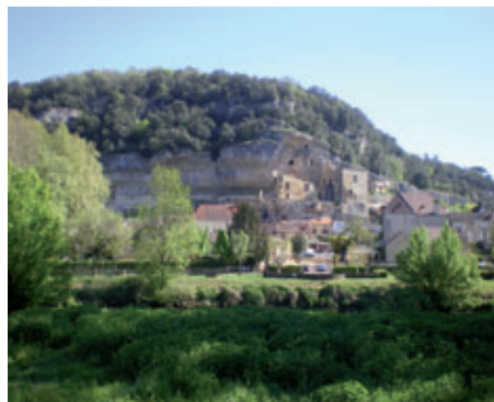
Les Eyzies

2h30 Le retour au village se fait par la plaine agricole. Profitez alors de la très belle vue sur les falaises : Eglise troglodytique de Guilhem, les Eyzies, le château et le Musée National de Préhistoire. Suivre le sentier qui passe au milieu du camping La Rivière avant de rejoindre la voie goudronnée qui vous amènera au pont pour rejoindre le Parking par la Promenade de la Vézère.